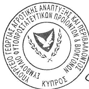
(Ανδρούλα Γεωργίου) Διευθύντρια Τμήματος Γεωργίας